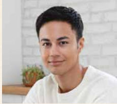
田野町公認キャラクター ユージ