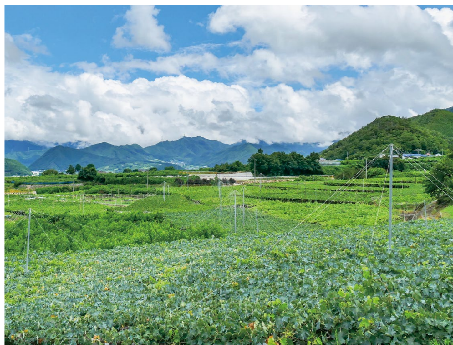
【夏の葡萄畑】(甲州市)