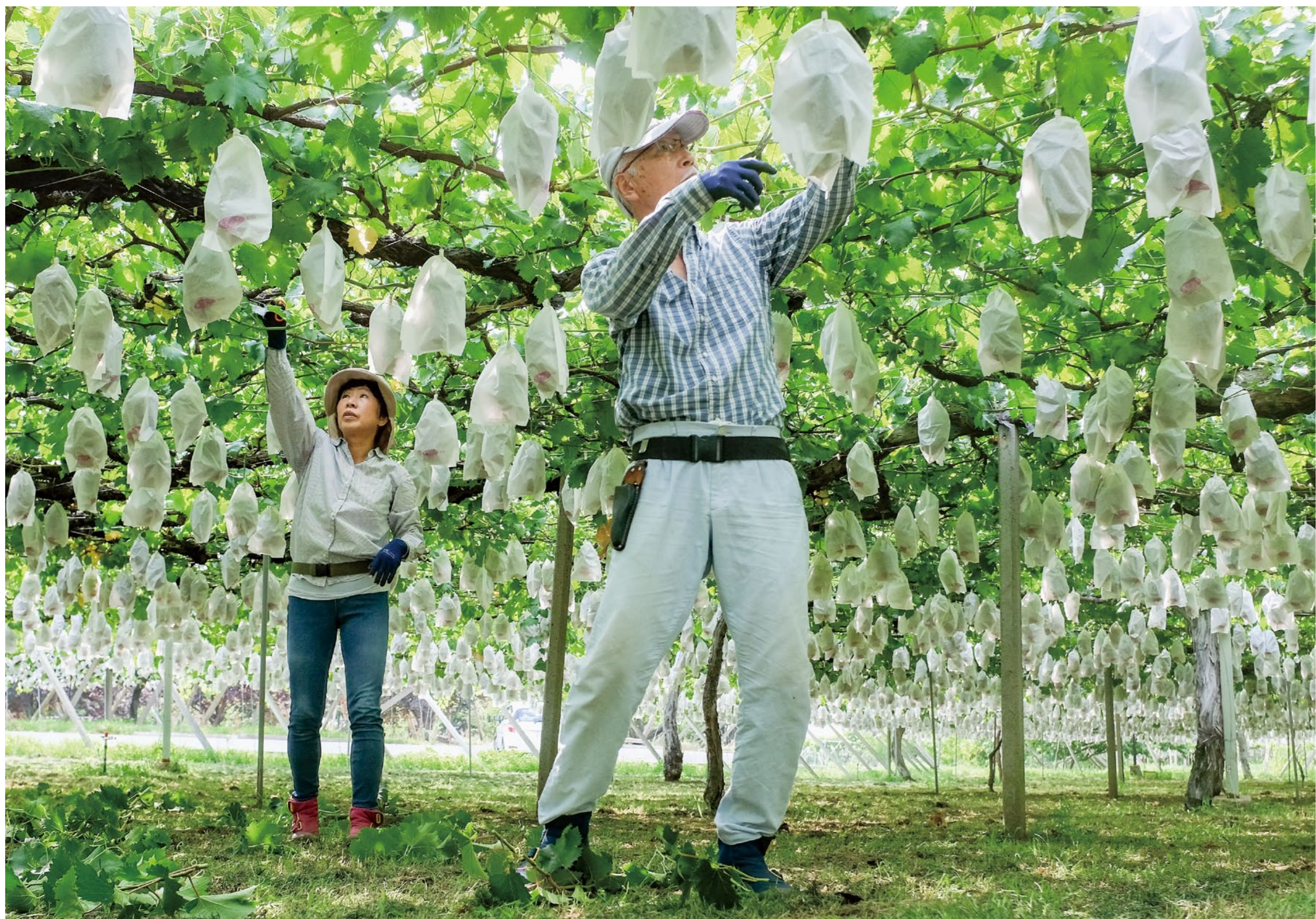
【葡萄栽培作業】(甲州市)