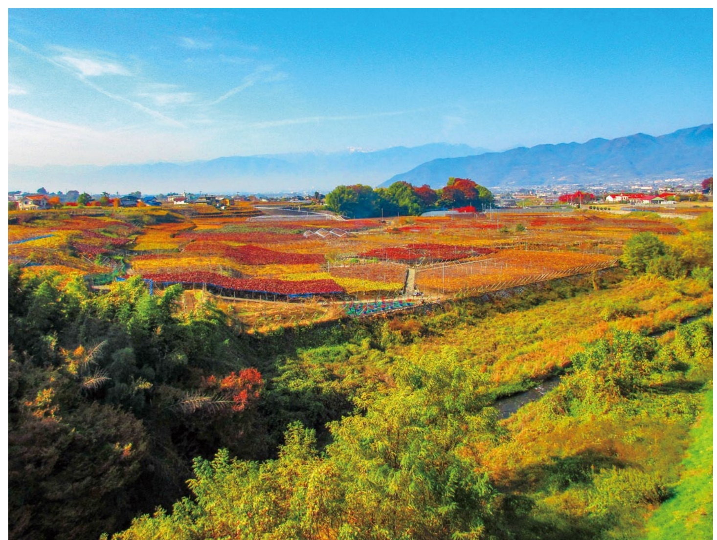
【秋の葡萄畑】(甲州市)

葡萄畑が広がる峡東地域の風景は、1000年を超える年月を掛けて作り上げられてきたものです。地域を訪れる人々が四季折々の景観、街並みに触れて心を躍らせるのは、この地域が積み重ねてきた葡萄栽培の歴史や、先人達の努力、互いに切磋琢磨し、高品質なワイン醸造に挑戦し続けるワイナリーの姿など、地域の特性が大きく影響しています。 季節の移ろいとともに変化する葡萄畑の風景の中には、今も受け継がれる技術や建物、日常生活の中に溶け込んだワインがあり、それらに触れることで山梨県峡東地域の魅力を誰もが感じることが出来ます。